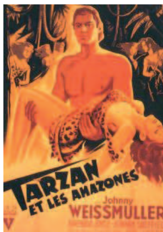
Amazone au masculin

au masculin (« notre cœur pleure pour nos enfants, pour nos fils »). Les images de la féminité ne semblent pas non plus très laudatives, à l'image de ce combattant qui déclare : « par rapport aux amazones, nos femmes aujourd'hui sont vraiment très courageuses, et en même temps elles ont aussi un peu de féminité » (essayez de comprendre cette phrase sans poser d'abord que féminité et courage sont contradictoires!). L'originalité culturelle